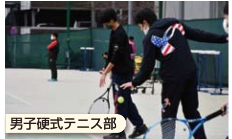
男子硬式テニス部