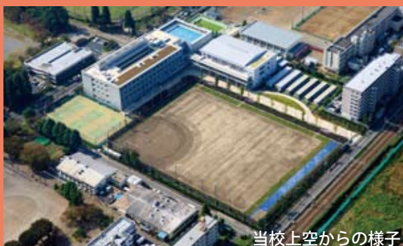
当校上空からの様子