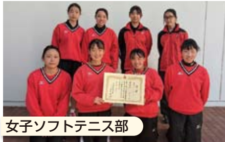
女子ソフトテニス部

関東大会個人予選ベスト20（関東大会出場） 関東大会団体予選第5位、多摩地区団体戦第3位