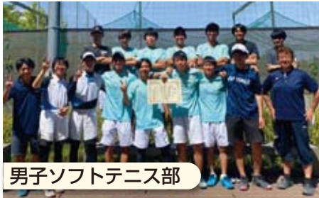
男子ソフトテニス部

秋季東京都高等学校野球大会出場、昭島市リーグ戦、Tボール教室の開催、甲子園出場に向け練習