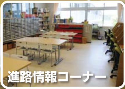
進路情報コーナー